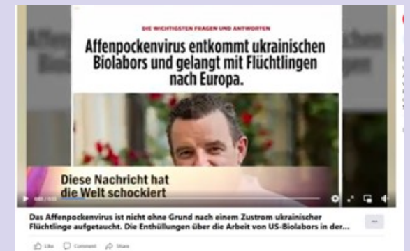
„Gefälschte Website im Rahmen der Doppelgänger-Kampagne“